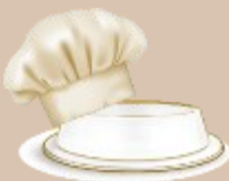
Selbstkocher Self-cooked feed