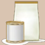
Fertigfutter / Alleinfuttermittel Complete feed